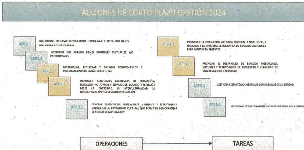
GRÁFICO N°2 ACCIONES DE CORTO PLAZO FC-BCB PLAN OPERATIVO ANUAL 2024

Elaboración: Sección de Planificación FC-BCB